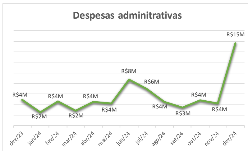
Gráfico: Dados do D.F da contabilidade do clube.

As despesas administrativas incluem custos com remuneração de funcionários administrativos, encargos, benefícios, serviços terceirizados, entre outros.