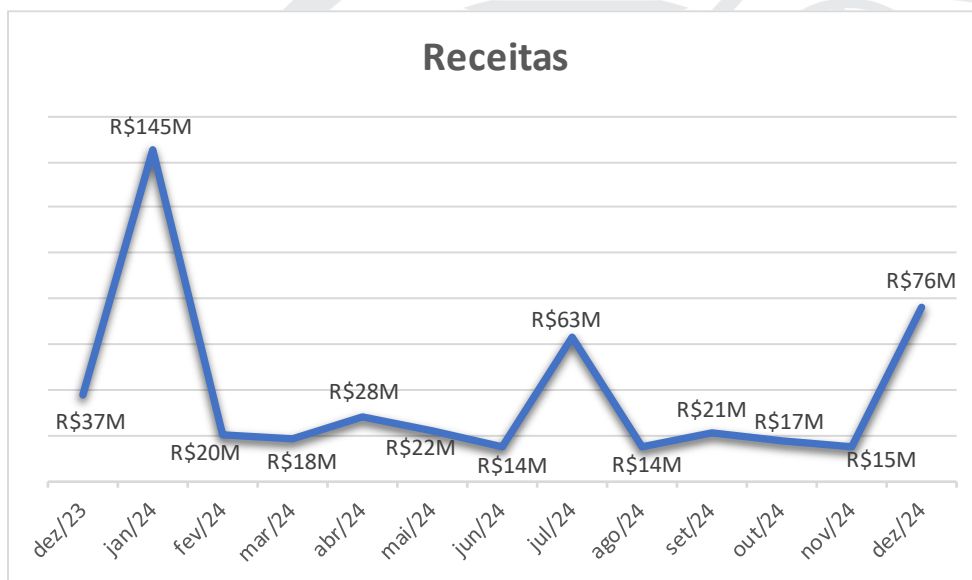
Gráfico: Dados do D.F da contabilidade do clube.

As receitas do Santos são definidas em seu Estatuto Social, artigo 85º, pág. 78. Elas englobam diversas entradas econômicas, tais como contribuições associativas, taxas de conservação, aluguéis, vendas de material, doações, multas, rendas de competições esportivas e publicidade, além de receitas provenientes de patrocínios, direitos federativos, subvenções públicas, entre outras fontes.