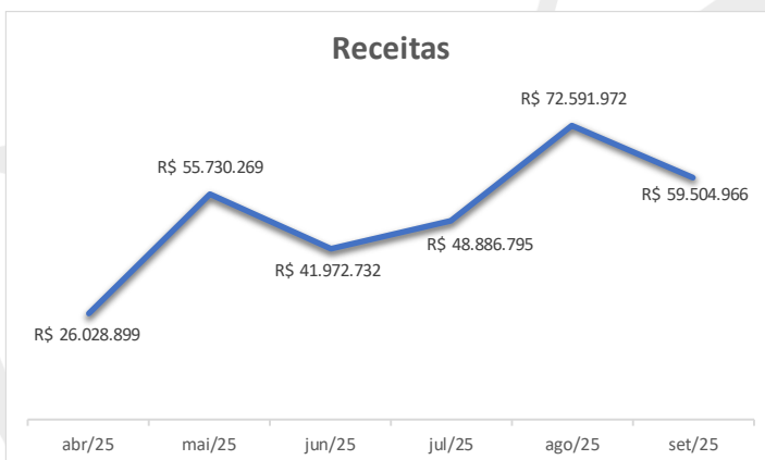
Gráfico: Dados do D.F da contabilidade do clube.

As receitas do Santos são definidas em seu Estatuto Social, artigo 85, pág. 78. Elas englobam diversas entradas econômicas, tais como contribuições associativas, taxas de conservação, aluguéis, vendas de material, doações, multas, rendas de competições esportivas e publicidade, além de receitas provenientes de patrocínios, direitos federativos, subvenções públicas, entre outras fontes.