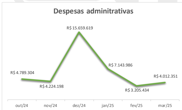
Gráfico: Dados do D.F da contabilidade do clube.

As despesas administrativas incluem custos com remuneração de funcionários administrativos, encargos, benefícios, serviços terceirizados, entre outros.